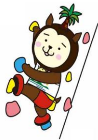
2027年第81回国民スポーツ大会 マスコットキャラクター