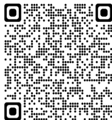
エントリーフォーム (google form)