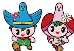
キックン・クーちゃん (木城町マスコットキャラクター)

主管 宮崎県山岳・スポーツクライミング連盟 宮崎スポーツクライミング協会(MSCA)